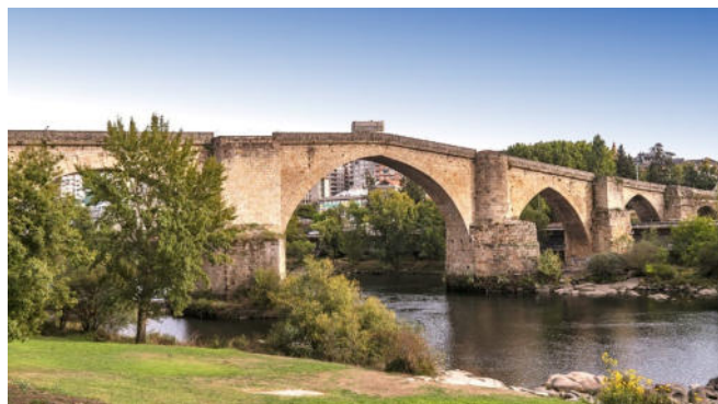
Romanische Brücke in Ourense

Erstes Ziel Ihrer heutigen Etappe ist die bereits von den Römern gegründete Provinzhauptstadt Ourense , zu deren bekanntesten Wahrzeichen die romanische Brücke über den Río Miño und die Kathedrale San Martín gehören. Ein herausragendes Beispiel romani-scher Bauplastik ist der Pórtico del Paradiso , dessen Vorbild das Portal der Kathedrale von Santiago de Compostela war. Mit ihrem Sterngewölbe ist die Kuppel über der Vierung ein Element gotischer Architektur. Der Schnitzaltar im Chor stammt aus dem frühen 16. Jh. und wurde von einem flämischen Meister geschaffen.