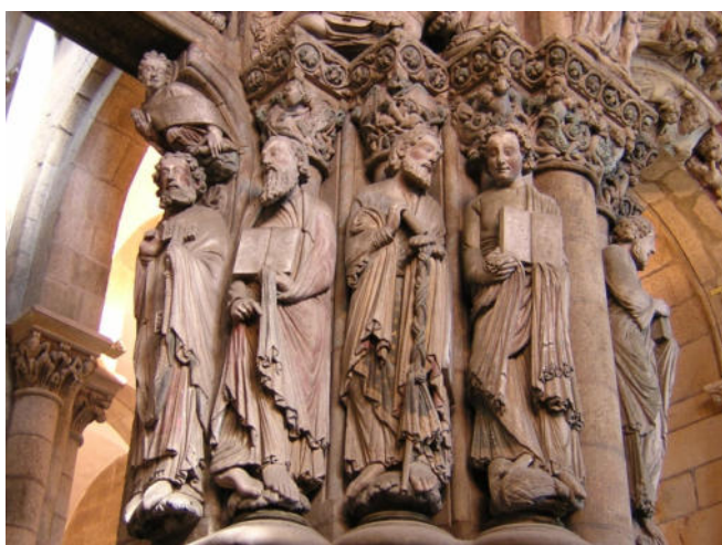
Apostel am Pórtico de la Gloria CCBY2.0 pedronchi at-flickr

Bei einem ausführlichen Spaziergang erkunden Sie die Altstadt von Santiago de Compostela, die seit 1985 zum UNESCO-Weltkulturerbe zählt. Im Mittelpunkt Ihrer Besichtigungen steht der Besuch der imposanten Kathedrale , die nach christlichem Glauben über dem Grab des Apostels erbaut wurde. Hinter der barocken Fassade an der weitläufigen Plaza do Obradoiro erhebt sich eine fast vollständig erhaltene romanische Kirche. Ein Meisterwerk mittelalterlicher Steinmetzkunst ist der berühmte Pórtico de la Gloria . Bewundern Sie die ausdrucksstarken Skulpturen des Eingangsportals, die zu den eindrucksvollsten Kunstwerken der Romanik gehören! Um 12:00 Uhr bietet sich die Gelegenheit zur Teilnahme an der täglich stattfindenden Pilgermesse.