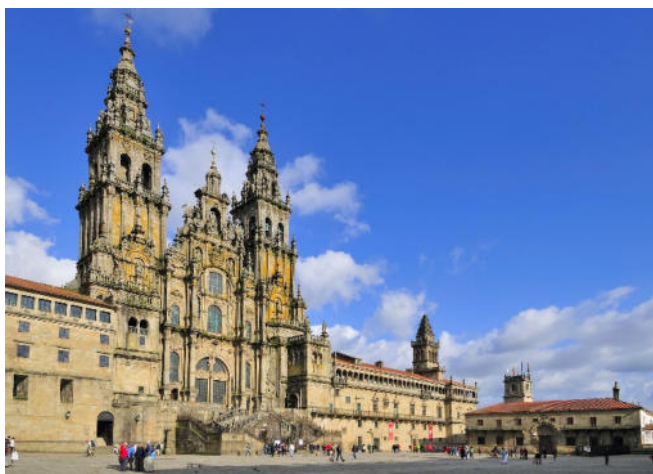
Kathedrale von Santiago de Compostela