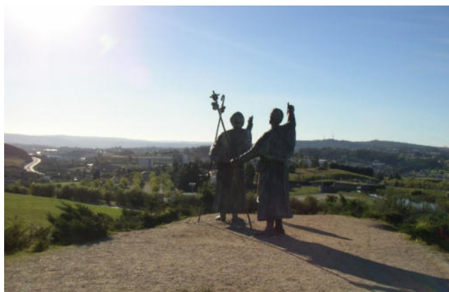
Monte do Gozo

Vorbei an Lavacolla, wo sich die Pilger des Mittelalters aus Liebe zum Apostel Jakobus den gesamten Körper wuschen, fahren Sie zum Monte do Gozo , den „ Berg der Freude “. Wie Generationen vor Ihnen erblicken Sie von hier zum ersten Mal die Türme der Kathedrale von Santiago de Compostela!